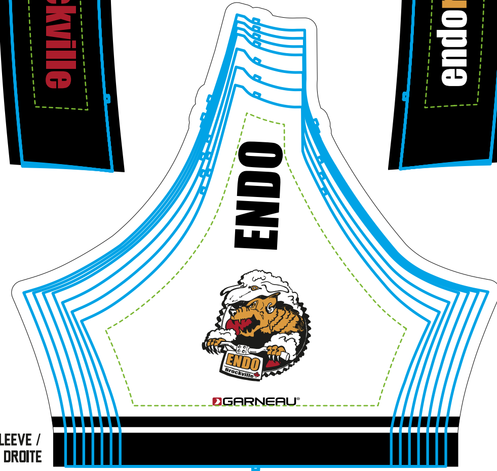
RIGHT SLEEVE / MANCHE DROITE