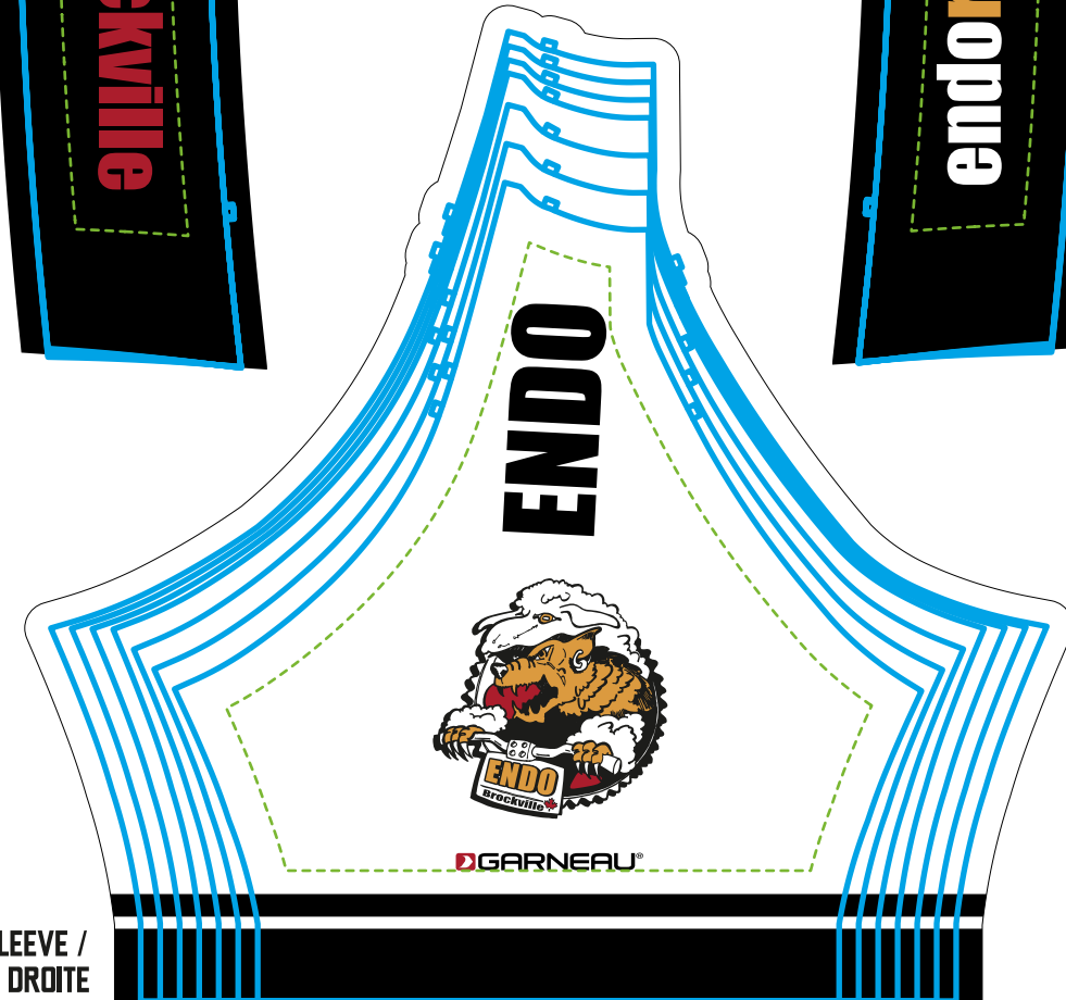
RIGHT SLEEVE / MANCHE DROITE