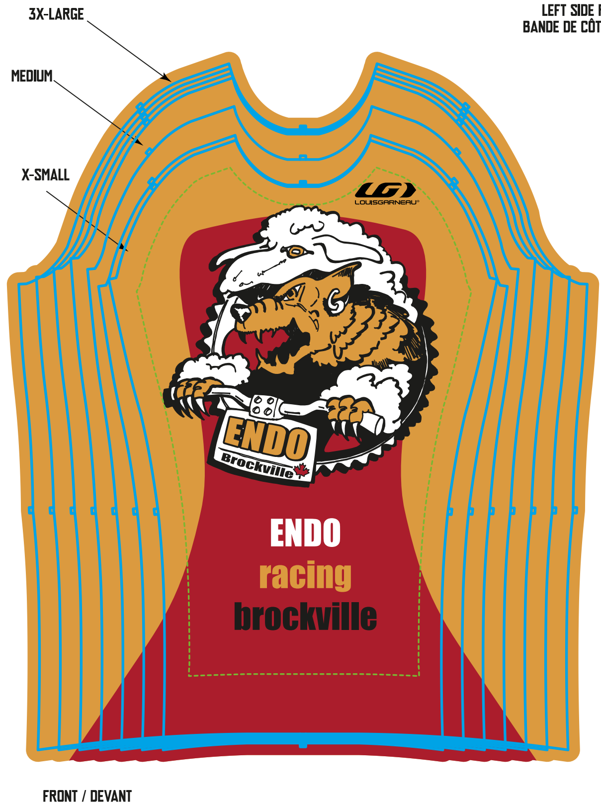
FRONT / DEVANT